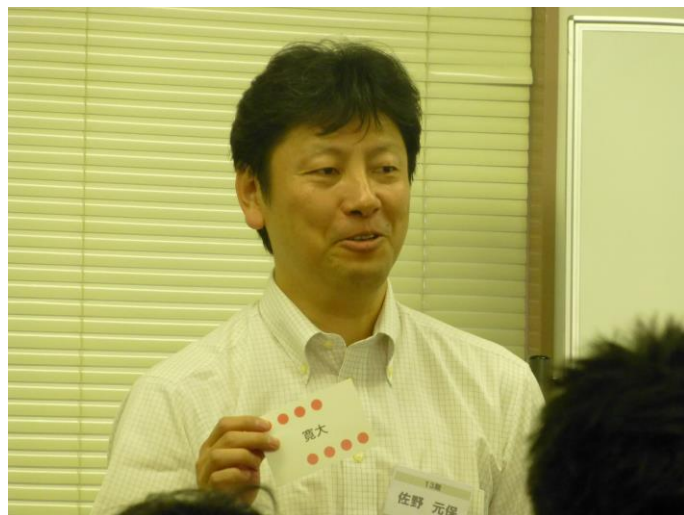
写真4 DiSC カードを使用した自己紹介