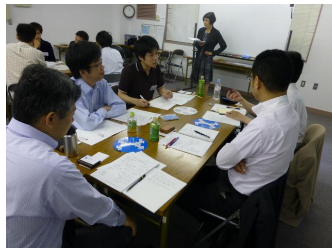
写真6 活発なグループ討議が行われました