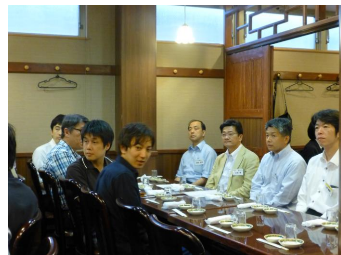
写真8 入塾式に参加する13期生の面々