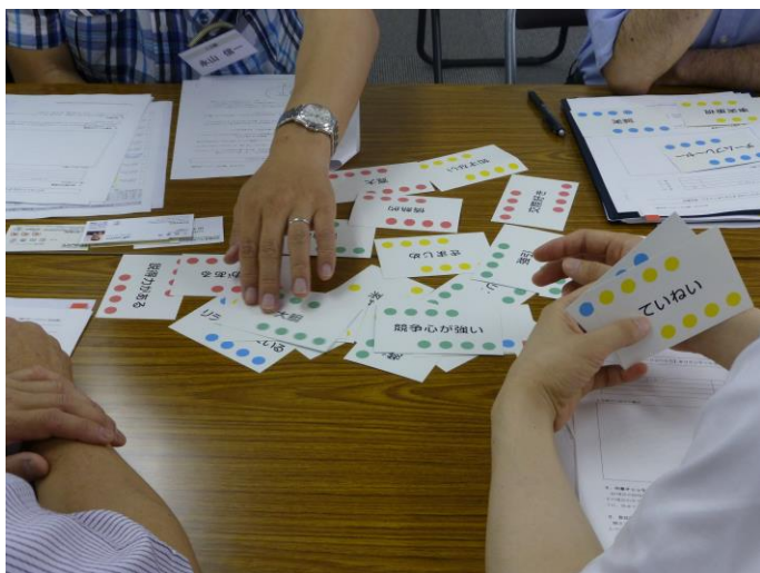
写真3 DiSC ツールを活用して自身の特性を把握