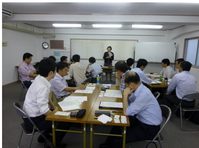
写真1 育成塾13期の講義がスタートしました！