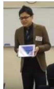
写真. 工夫を凝らした プレゼンテーションをする18期生

塾生からの講義後の振り返りにも、「今までの指導内容が踏まえられており、ますます良いプレゼン