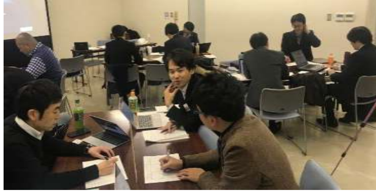
写真. ヒアリングに向けて最終準備をする 18 期生

ヒアリング時間は限られていますので、他の班とヒアリングのポイントに重複が生じないように留意する必要があります。そのため、各班代表の検討内容の発表を行い、皆で共有しました。