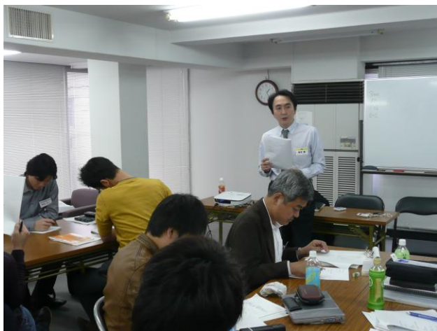
写真 5 塾生たちは出版のための企画の立案中