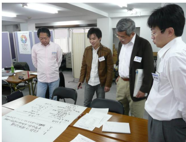
写真2 実際に研修企画を模造紙に書き出します