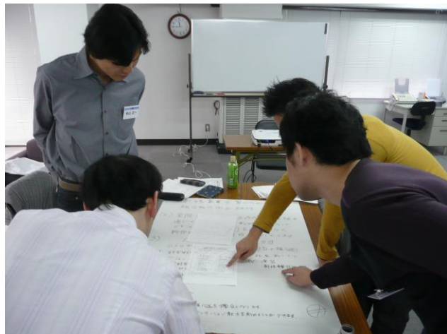
写真3 企画内容について話し合いが行われます