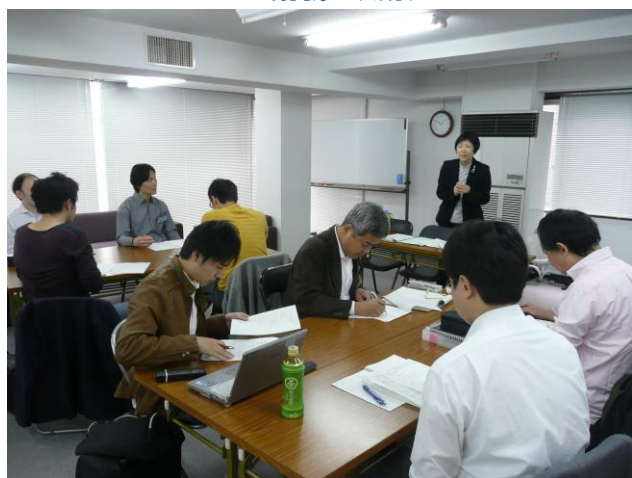
写真1 レジュメおよび研修企画の作り方のレクチャー